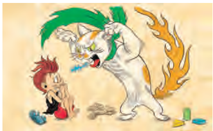
『ばけねこぞろぞろ』石黒亜矢子(あかね書房、2015年)