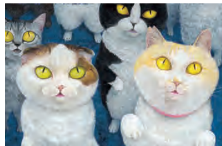
『ネコゾメのよる』町田尚子(WAVE出版、2016年)