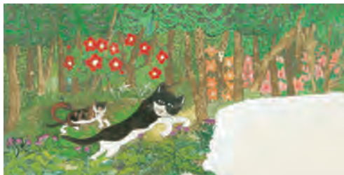
『けとばしやまのいばりんぼ』大道あや(小峰書店、1980年)