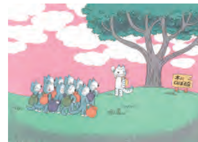
『11びきのねこふくろのなか』馬場のぼる(こくま社、1982年)