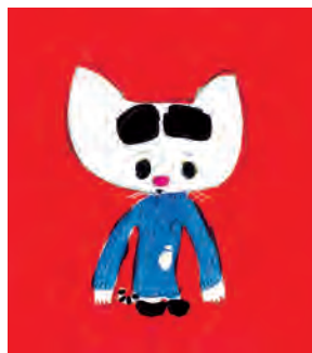
『ねこのセーター』100%ORANGE (文溪堂、2016年【学研プラス、2006年】)