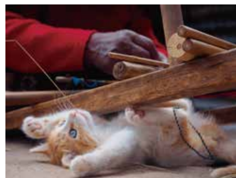
ペルー、タキーレ島

※中学生以下無料、前売りは各200円引 ※前売券販売所：中国新聞販売所（取り寄せ）、啓文社各店、JR尾道駅内観光案内所、生協ひろしま ※70歳以上、各種手帳（ミライロID可）をお持ちの方は証明できるものを提示により無料 主催：尾道市立美術館、中国新聞備後本社 企画制作：クレヴィス 後援：広島県、尾道エフエム放送、ちゅピCOMおのみち、エフエムふくやま