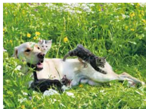
スイス、ヴェンゲン