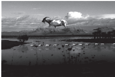
さわひらき Hiraki SAWA 《Eight minutes》 2005