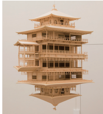
岩崎貴宏 Takahiro IWASAKI 《リフレクション・モデル(金閣)》 Reflection Model(Kinkaku) 2017

出展作品作家 (50音順) 会田誠 荒木経惟 岩崎貴宏 大竹伸朗 小沢剛 オノ・ヨーコ 草間彌生 鴻池朋子 さわひらき 杉本博司 田名網敬一 照屋勇賢 天明屋尚 奈良美智 蜷川実花 畠山直哉 舟越桂 村上隆 森山大道 山口晃