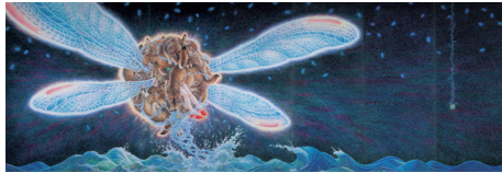
鴻池朋子 Tomoko KONOIKE 《第4章 帰還-シリウスの曳航》 Chapter Four "The Return-Sirius Odyssey" 2004 ©Tomoko KONOIKE