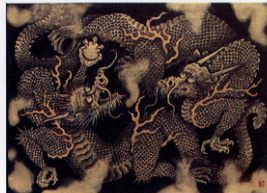
《建仁寺天井画草葉》平成12年(2000)

中札内美術村(北海道河西郡中札内村)は、帯広市郊外にあり、カシワの木が鬱蒼と生い茂る広大な敷地内に、「北の大地美術館」「小泉淳作美術館」「相原求一朗美術館」「夢想館」の4館が点在するかたちで構成されています。