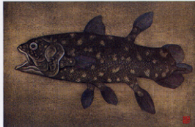
《シイクサス》平成11年(1999)