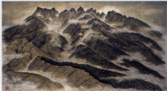
《根子岳前後》平成8年(1996)