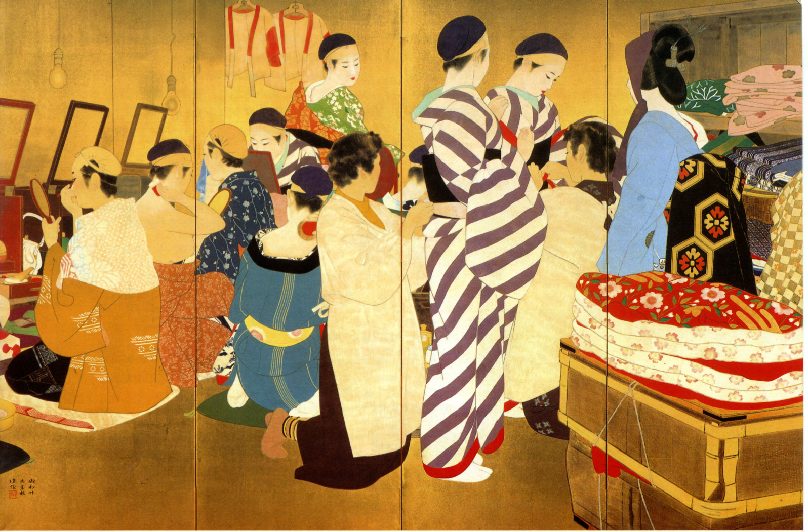
伊東深水《春宵（東おどり）》〔部分〕