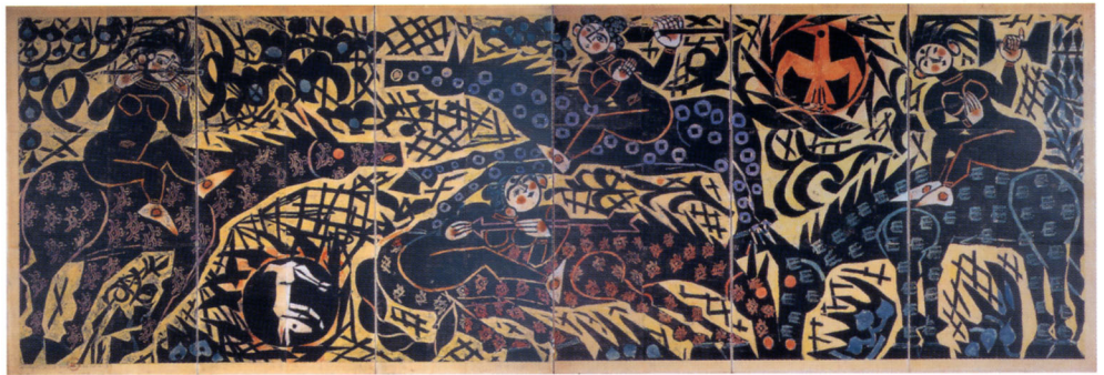
棟方志功《花矢の楯》1961年