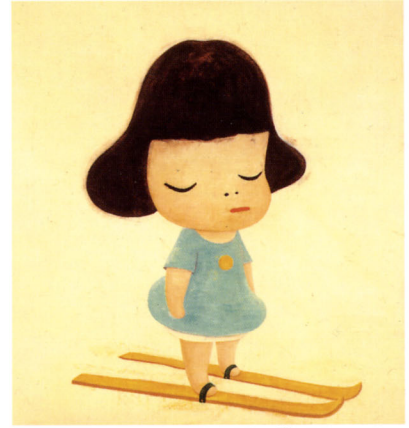
奈良美智《So far apart》1996年 ©Yoshitomo Nara

青森県立美術館 AOMORI MUSEUM OF ART >>>> ONOMICHI CITY MUSEUM OF ART