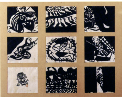
棟方志功《勝鬘菩薩知鳥版画曼陀羅》1938年