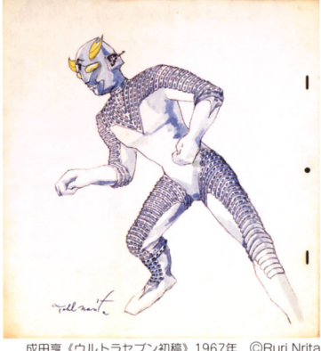
成田亨《ウルトラセブン初稿》1967年 ©Ruri Nrita

青森県立美術館は三内丸山の縄文遺跡に隣接し、真っ白な建物がとても印象的な美術館です。近現代の青森ゆかりの作家や国内外の著名な作家たちの優れた作品をコレクションしている美術館として知られています。