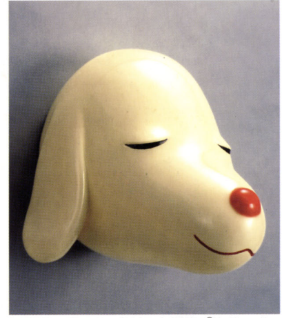
奈良美智《Dog From Your Childhood》1997年 ©Yoshitomo Nara