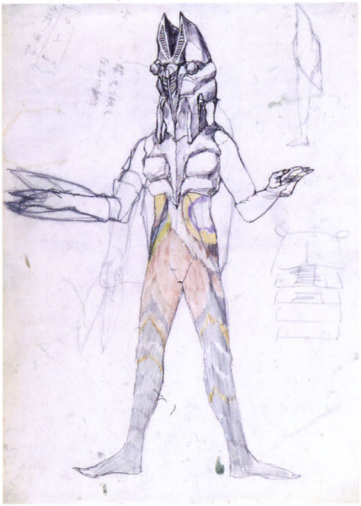
成田亨《バルタン星人初稿》1966年 ©Ruri Nrita