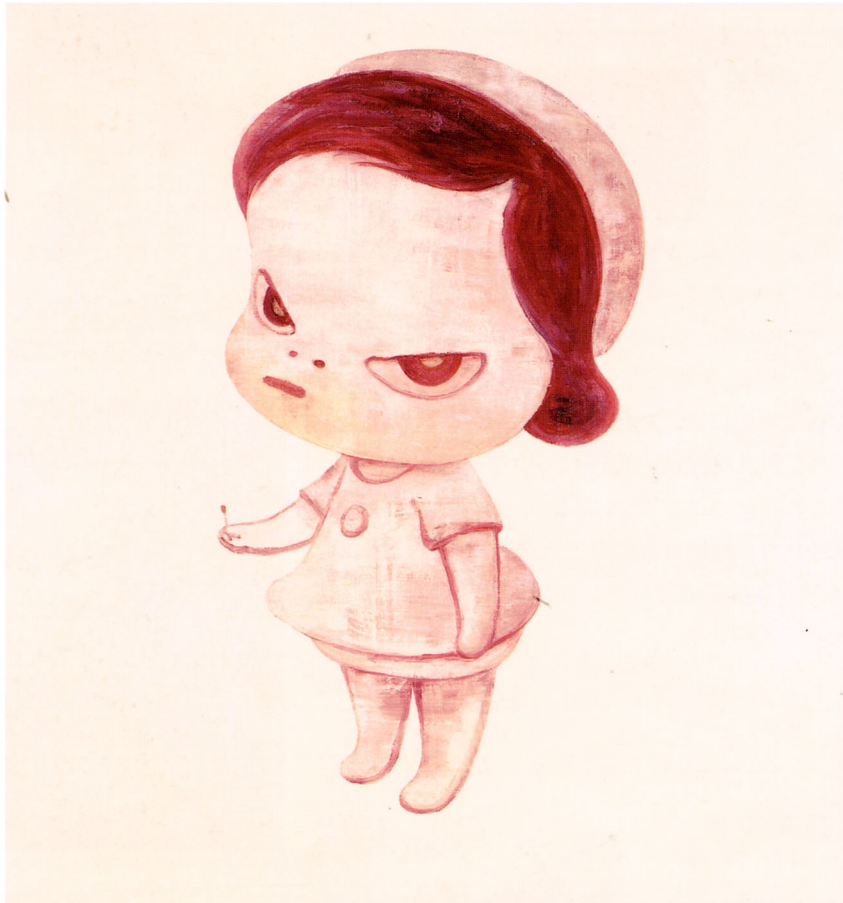
奈良美智《The Last Match》1996年 © Yoshitomo Nara