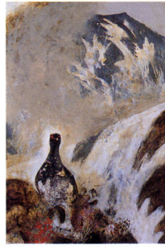
《雷鳥》1982 富山県立近代美術館