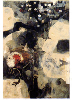
《鶏 (春の庭)》1988 砺波市美術館