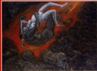
《事実と妄想の迫間》2007