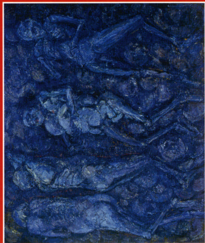
《ヒロシマの記録(黒い雨)》2007