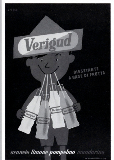
⑤ ヴェリグッド(1955年) リトグラフ/ポスター サントリーミュージアム[天保山]