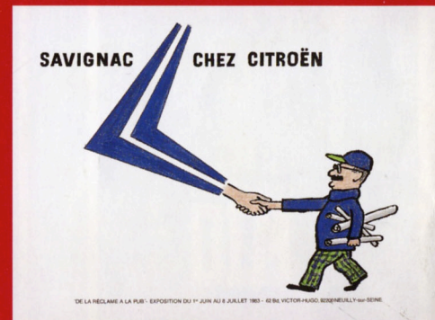
(上) シトロエン社でのサヴィニャック展(1983年) オフセット/ポスター サントリーミュージアム[天保山] (右) 牛乳石鹸モンサヴォン(1948/50年) リトグラフ/ポスター サントリーミュージアム[天保山]

瀬戸内海を一望する千光寺公園山頂の美術館—— 尾道市立美術館 ONOMICHI CITY MUSEUM OF ART