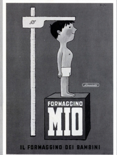
④ ミオチーズ(1958年) リトグラフ/ポスター サントリーミュージアム[天保山]