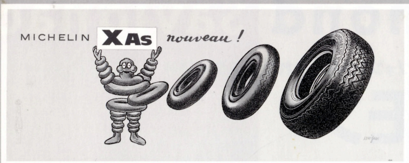
① ミシュラン(1966年) リトグラフ/ポスター サントリーミュージアム[天保山]