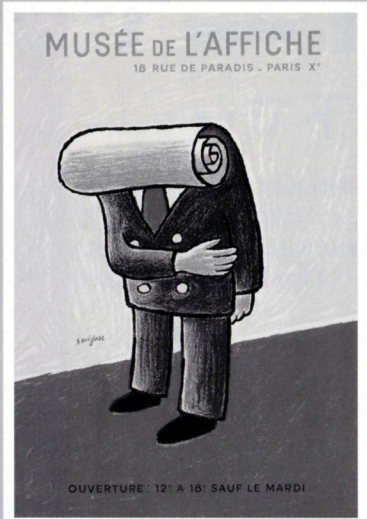
③ ポスター美術館(1978年) オフセット/ポスター サントリーミュージアム[天保山]