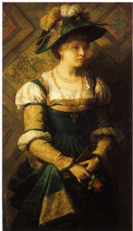
ハンス・マカールト (工房) 《恋人を待つ》