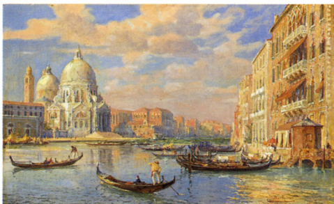
ロベルト・ナドラ 《ヴェネツィア》 19世紀末