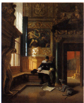
ラインハルト・セバスチャン・ツィンマーマン 《画廊のルートヴィヒ2世》