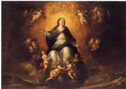
セバスチャン・ガルシア・バスケス 《無原罪の御宿り》