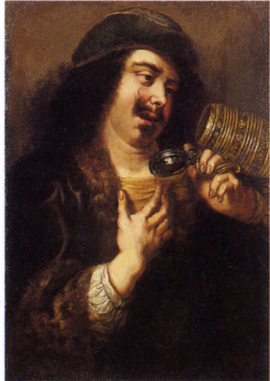
ヤン・コシエルス 《空のジョッキを持つ酒飲み》