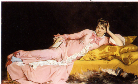
ジョルジュ・ルフェーヴル 《青いストッキングをはいた女流詩人》 1870年頃