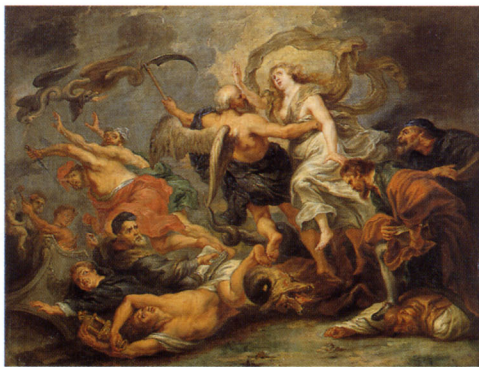
ルーベンス周辺の画家 《異端に対する聖餐の真実の勝利》