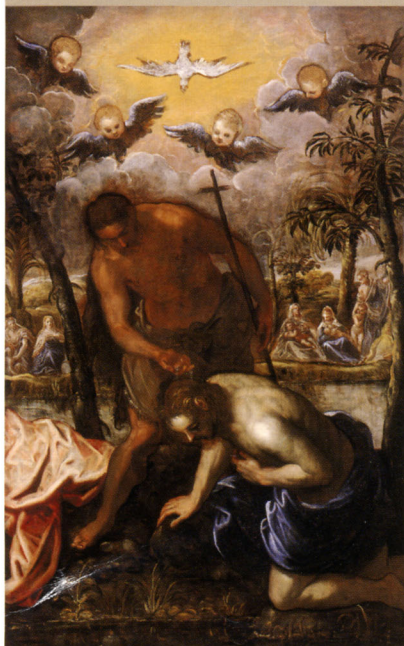
ティントレット(子)《キリストの洗礼》