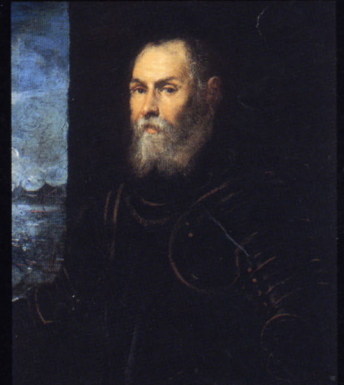
ティントレット《ヴェネツィア提督の肖像》