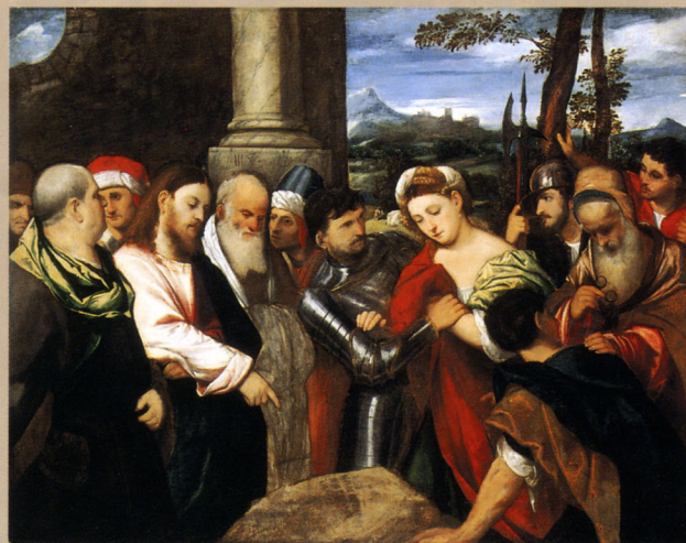
ポニファチオ・ヴェロネーゼ《キリストと姦淫の女》