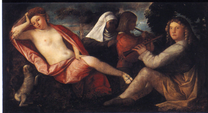
カリアーニ《田園の奏楽》

ONOMICHI CITY MUSEUM OF ART 尾道市立美術館 〒722-0032 尾道市西土堂町17-19千光寺公園内 Tel.0848-23-2281