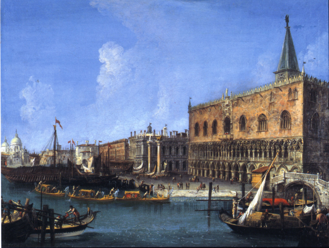
ミケーレ・マリエスキ《パラッツォ・ドゥカーレ（総督宮）》