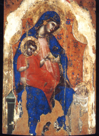
ロレンツォ・ヴェネツィアーノ 《聖母子と聖ベルナルドゥス》