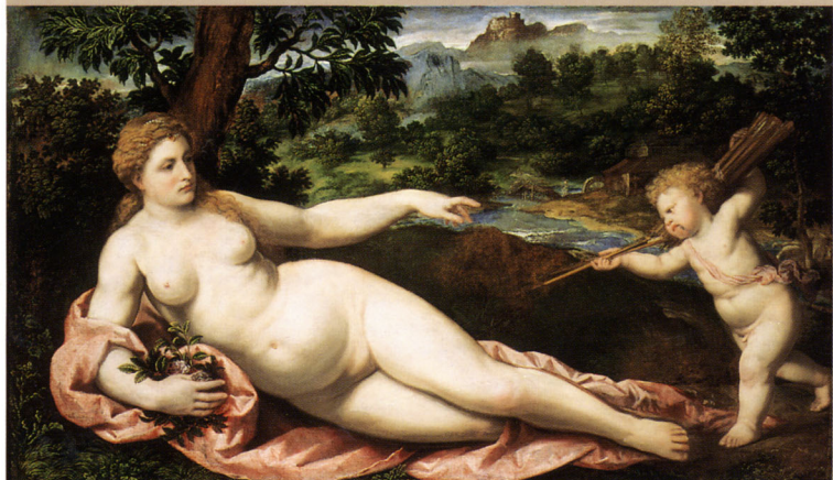
パリス・ボルドーネ《ウェヌスとクピド》